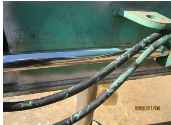
아웃트리거 유압 실린더 및 권과방지장치 상태 점검 - 상태 양호