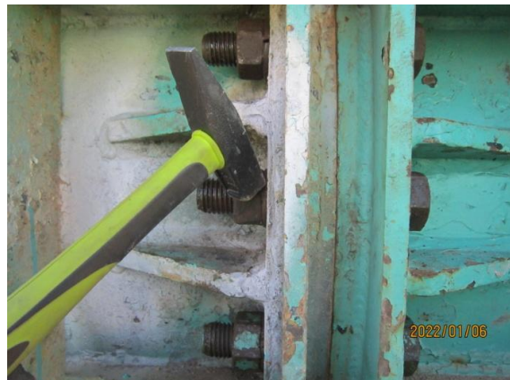
리더 볼트체결 상태 점검 - 상태 양호