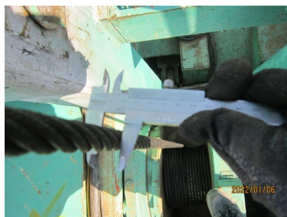
와이어로프상태 및 드럼 역회전방지장치 상태 점검 - 상태 양호