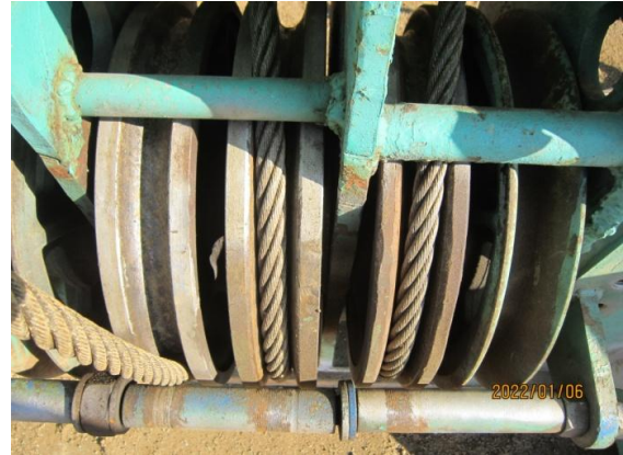
탐시브 육안 및 와이어 시브 상태 점검 - 상태 양호