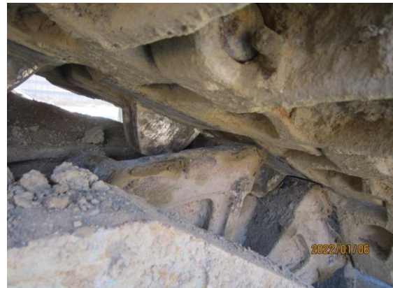
트랙 및 와이어로프 클립체결 상태 점검 - 상태 양호