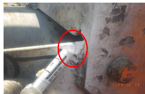
Arm(트라이앵글) / Crack