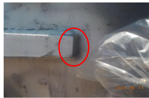
Leader / 용접 부족