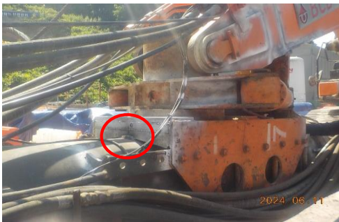
Arm(트라이앵글) / 전경