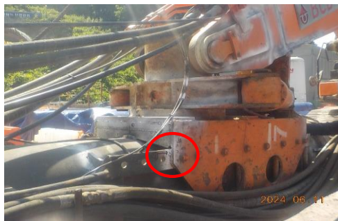
Arm(트라이앵글) / 전경