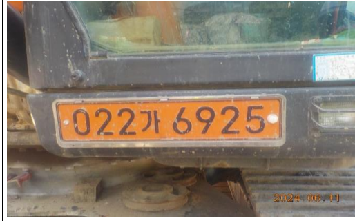
천공기 / 전경