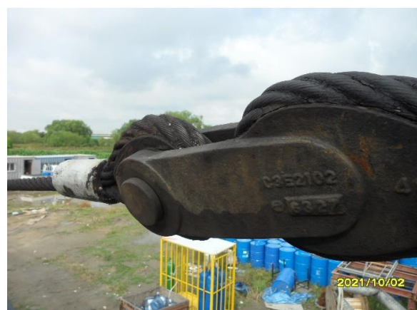
펜던트 와이어 설치상태 양호