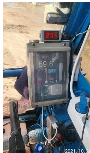
운전석 내부 상태 양호 후방카메라 및 인디게이터 작동상태 양호