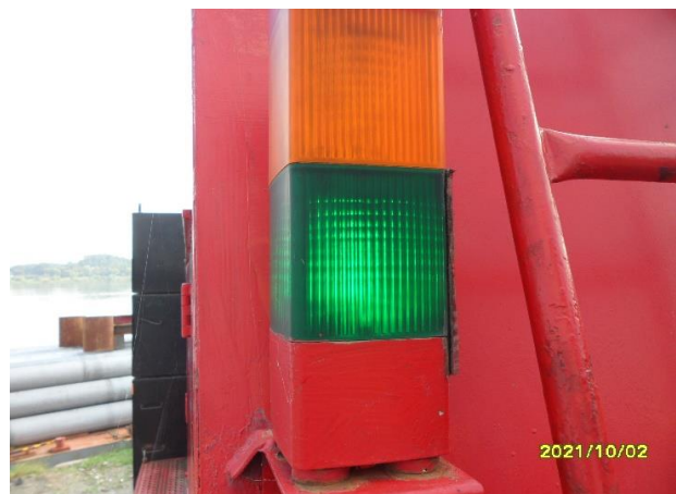
권과방지장치 작동상태 확인 이상무 / 작업상태등 상태 이상 무