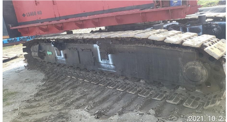
궤도 상태 양호