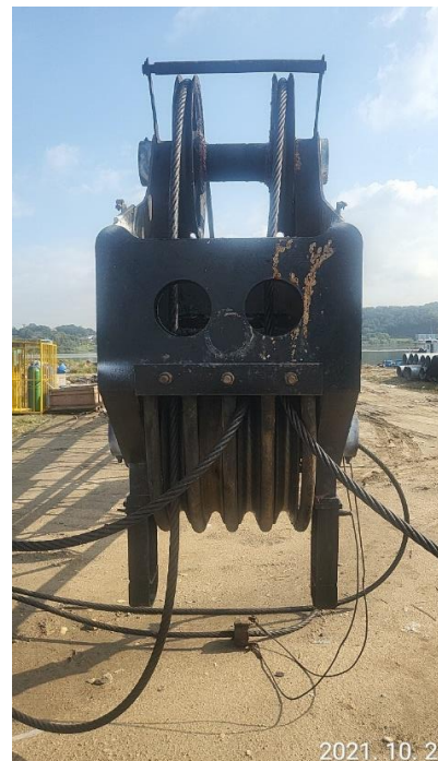
봄 상태 양호 / 시브 상태 양호