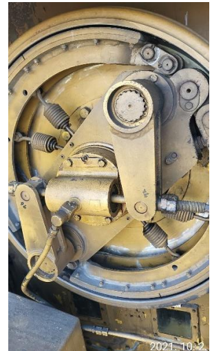
브레이크 상태 양호